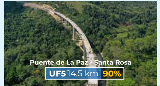
Puente de La Paz - Santa Rosa