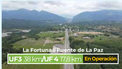
La Fortuna - Puente de La Paz