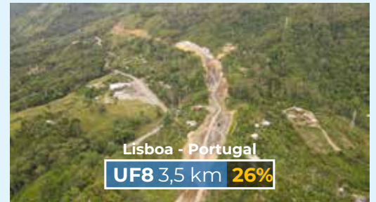
Lisboa - Portugal