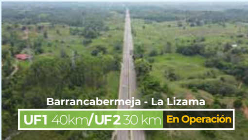
Barrancabermeja - La Lizama