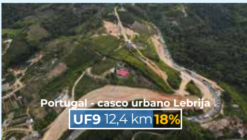
Portugal - casco urbano Lebrija