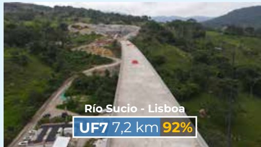
Río Sucio - Lisboa